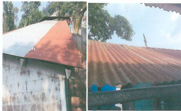
Foto 2: En las aulas se necesita cambiar las láminas que están en mal estado, mejoramiento del techo de la cocina.