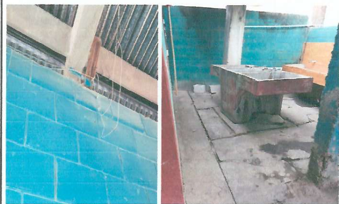
Foto 1: Vista de los cables de energía eléctrica y mejoramiento del piso y base del tinaco.